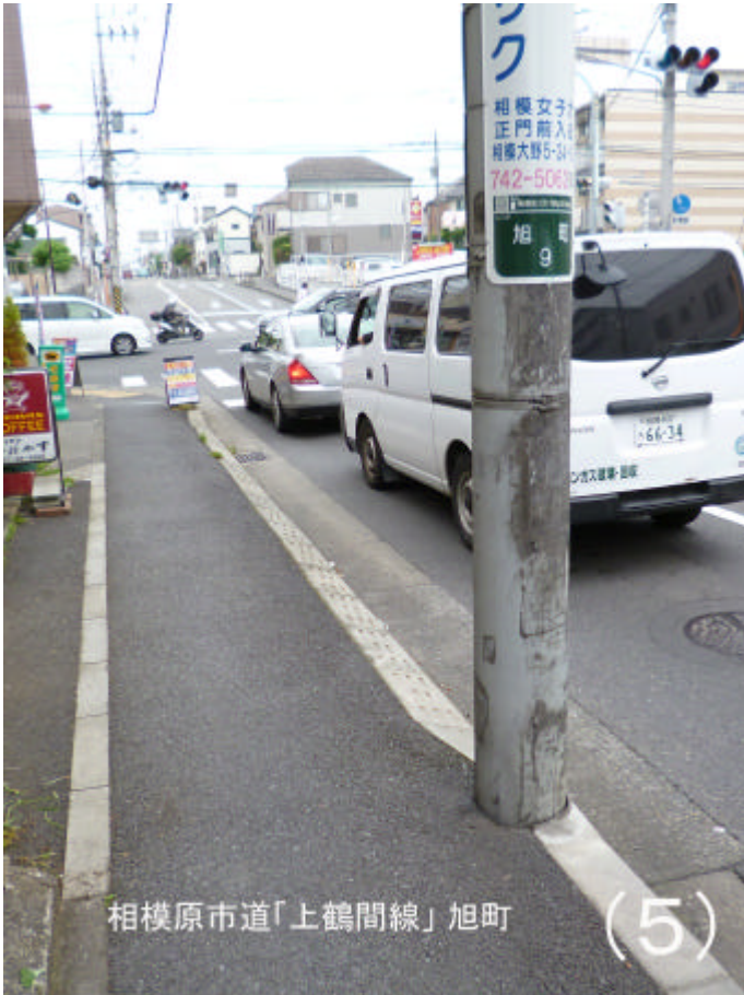
相模原市道「上鶴間線」旭町 (5)