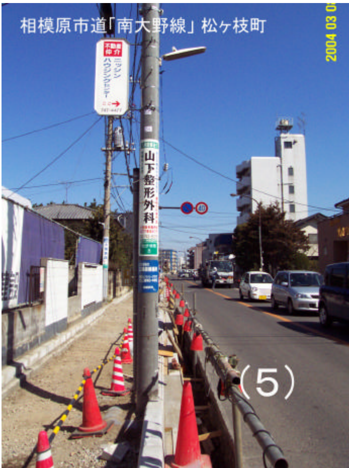
相模原市道「南大野線」松ヶ枝町 (5)